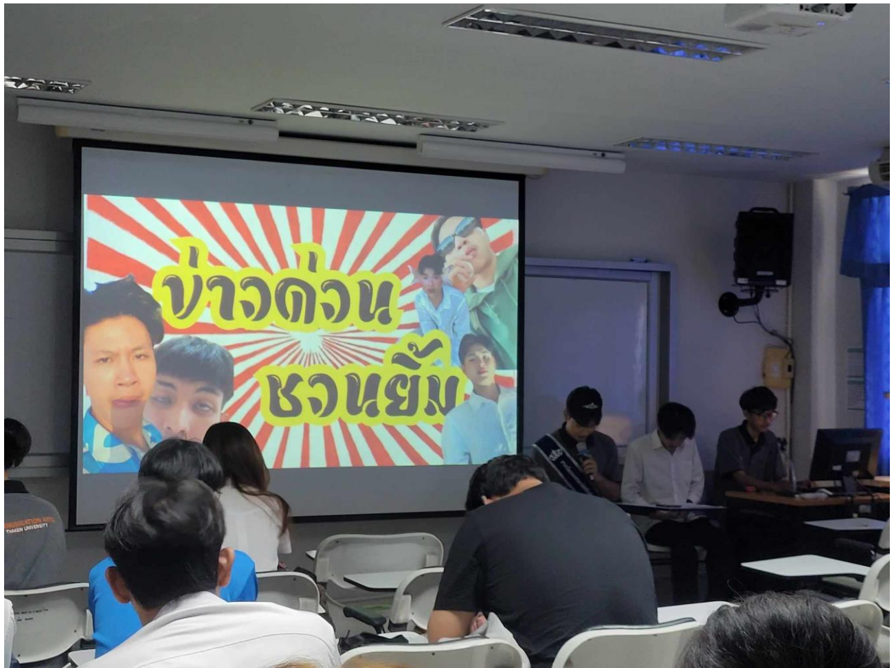
คณะมนุษยศาสตร์และสังคมศาสตร์ มหาวิทยาลัยทักษิณ ปัญญา จรรย์ธรรม นำการพัฒนามนุษย์และสังคม