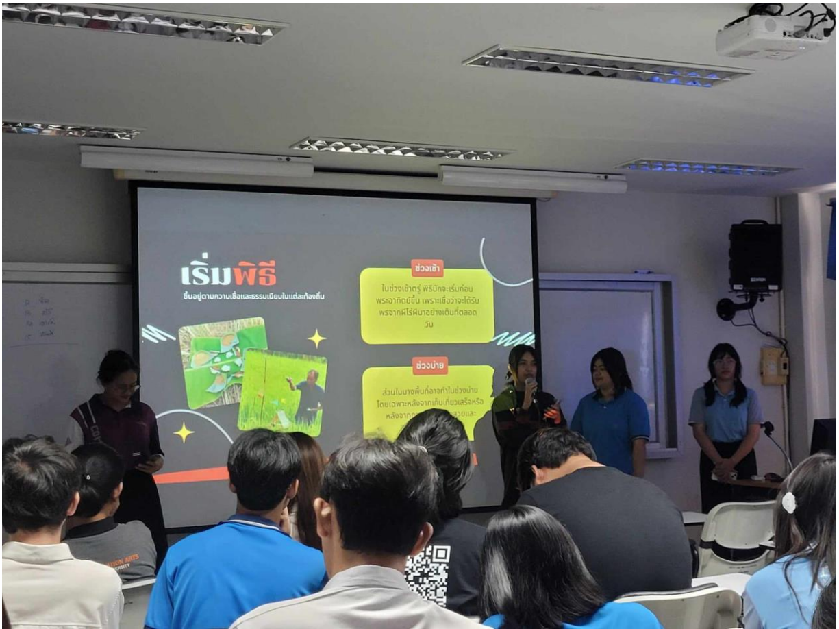
คณะมนุษยศาสตร์และสังคมศาสตร์ มหาวิทยาลัยทักษิณ ปัญญา จริยธรรม นำการพัฒนาคนและสังคม