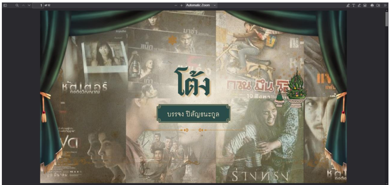
คณะมนุษยศาสตร์และสังคมศาสตร์ มหาวิทยาลัยทักษิณ ปัญญา จริยธรรม นำการพัฒนามนุษย์และสังคม