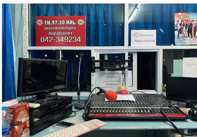
รูปภาพที่ (3) บรรยากาศภายในห้องจัดรายการของสถานีวิทยุชุมชนคนรักอุดร (ภาพได้รับการอนุญาตให้เผยแพร่ ถ่ายภาพโดย สิทธิพันธ์ จันทวัน, 2564)