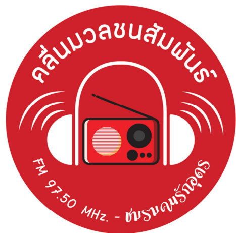
รูปภาพที่ (5) ตราสัญลักษณ์ของสถานีวิทยุที่มีการปรับเปลี่ยนให้ดูทันสมัย

แม้ว่าคนในท้องถิ่น จะไม่สามารถแยกภาพลักษณ์ของสถานีวิทยุ FM 97.5 เมกกะเฮิร์ต “วิทยุชุมชนคนรักอุดร” ให้ออกจากการเมืองไปได้ หากแต่ในปัจจุบัน สถานี “วิทยุชุมชนคนรักอุดร” ยังทำหน้าที่เป็นศูนย์กลางในการจัดกิจกรรมทางสังคมอื่นๆ อย่างต่อเนื่อง ทั้งที่เป็นกิจกรรมในหมู่สมาชิกจากเครือข่ายวิทยุที่สืบเนื่องจากการเมืองในอดีต ได้แก่ การเยี่ยมนักโทษเสื้อแดงซึ่งเป็นคดีการเมือง การจัดงานวันเกิดให้อดีตแกนนำคนเสื้อแดง และกิจกรรมในชุมชนอื่นๆ เช่น การประชาสัมพันธ์งานบุญประเพณี และหมอลำในพื้นที่ การแจ้งเตือนภัยพิบัติ การเฝ้าระวังสถานการณ์ไวรัส COVID-19 ในจังหวัดอุดรธานี รวมถึงเป็นศูนย์กลางประสานงานชมรม/เครือข่ายทางสังคมที่สำคัญ นั่นคือ สมาคมฌาปนกิจสงเคราะห์ ชมรมคนรักอุดร ที่เป็นเสมือนกองทุนที่สนับสนุนงบประมาณการประกอบฌาปนกิจแก่สมาชิก เงิน