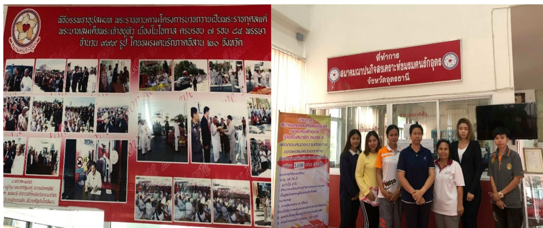
รูปภาพที่ (4) กิจกรรมของ “วิทยุชุมชนคนรักอุดร” ที่ผ่านมา และ การขอสัมภาษณ์ผู้ให้ข้อมูล (ภาพได้รับการอนุญาตให้เผยแพร่ ถ่ายภาพโดย สิทธิพันธ์ จันทวัน, 2564)

ดังนั้น จึงสะท้อนให้เห็นว่า แม้ภาครัฐส่วนกลางจะพยายามลดบทบาททางการเมืองของสถานีวิทยุ FM 97.5 เมกกะเฮิร์ต “วิทยุชุมชนคนรักอุดร” ในฐานะกระบอกเสียงของคนต่อต้านรัฐบาลด้วยอำนาจที่มีในมือ แต่ด้วยอุดมการณ์และความสนใจทางการเมืองของสถานีวิทยุชุมชนที่เคยขับเคลื่อนมาอย่างเหนียวแน่น ทำให้ไม่อาจดึงประเด็น “การเมือง” ออกจากเนื้อหาการนำเสนอได้ สะท้อนให้เห็นความอยากมีส่วนร่วมทางการเมืองของท้องถิ่น ไม่ว่าจะในระดับชาติหรือท้องถิ่น ที่ยังคงมีมาจนกระทั่งถึงปัจจุบัน