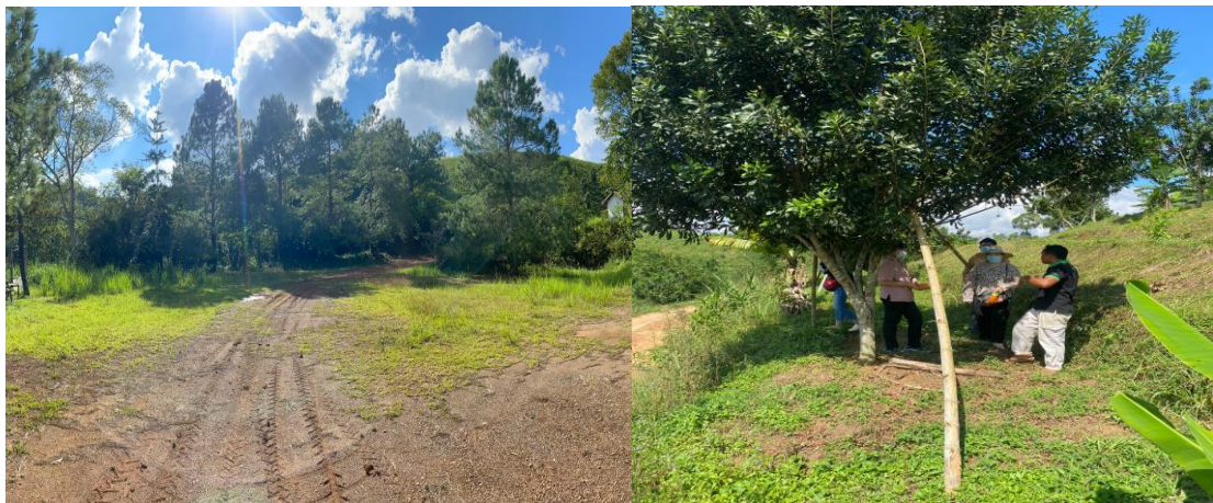
ภาพที่ 5 แสดงเส้นทางการเดินทางทำให้นักท่องเที่ยวได้ชมธรรมชาติเพื่อการท่องเที่ยวบ้านหินสอ