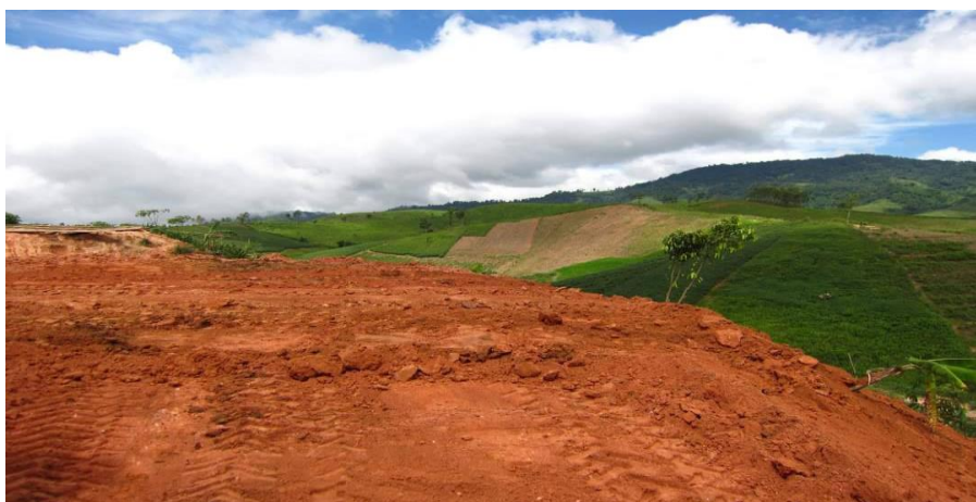
ภาพที่ 6 แสดงเส้นทางที่นักท่องเที่ยวขับขี่จักรยานเพื่อการท่องเที่ยวบ้านหินสอปั่นจักรยานชมสวนแก้วมังกรชมสวนแมคคาเดเมีย