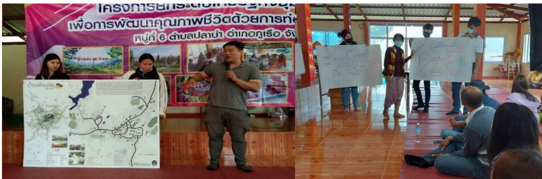
ภาพที่ 8 แสดงการสรุปผลการจัดกิจกรรมมีการพัฒนาโดยใช้กระบวนการมีส่วนร่วมในการศึกษาเส้นทางการท่องเที่ยวประกอบกับการมีส่วนร่วมการแลกเปลี่ยนเรียนรู้แสดงความคิดเห็นเสนอแนะแนวทางเพื่อนำไปสู่การพัฒนาต่อไป