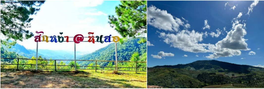
ภาพที่ 7 แสดงจุดชมวิวกว้างมองเห็นวิวทิวทัศน์ที่เต็มไปด้วยธรรมชาติ มีภูเขาต้นไม้ที่เต็มไปด้วยต้นไม้สีเขียว