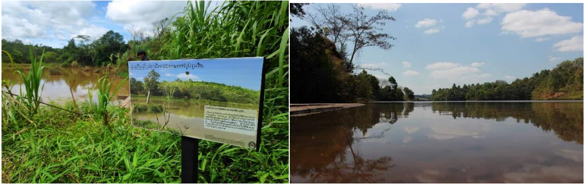
ภาพที่ 4 แสดงป้ายอ่างเก็บน้ำสถานีทดลองเกษตรที่สูงและจุดชมวิวอ่างเก็บน้ำภูเรือ เพื่อเป็นการกักเก็บน้ำให้ใช้ในการเกษตรของชาวบ้านในยามจำเป็น