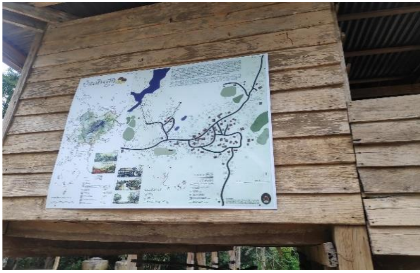
ภาพที่ 3 แสดงป้ายบอกเล่าประวัติศาสตร์ชีวิต ความเป็นชุมชน วิถีของชุมชนวัฒนธรรมที่แสดงถึงความยั่งยืน เพื่อนเป็นมรดกให้คนรุ่นต่อไปได้อยู่ดีมีสุข