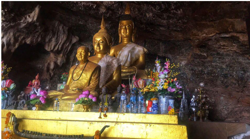
ภาพที่ 1: รูปปั้นหลวงปู่หลุย จันทสาโร ภายในถ้ำภูบ่อปิด

บทความนี้ได้รวบรวมเอาประวัติความเป็นมาของภูบ่อปิดตั้งแต่มีการเปลี่ยนชื่อจากเดิมคือภูบักปิดมาเป็นภูบ่อปิด และเหตุการณ์ที่เกิดขึ้นเป็นลำดับมา ตามคำบอกเล่าของคุณลุงทั้งสองท่านที่ได้ชื่อว่าปราชญ์ชาวบ้านที่ได้ให้ข้อมูลที่ตรงกัน ทั้งในเชิงที่จับต้องได้และจับต้องไม่ได้สู่ความเป็นสถานที่ท่องเที่ยวทั้งเชิงนิเวศและวัฒนธรรม จนกระทั่งเป็นมิติที่เชื่อมโยงมาสู่สวนสาธารณะกุดป่องอย่างต่อเนื่องจนทำให้สถานที่สองแห่งนี้เป็นที่ท่องเที่ยวและพักผ่อนหย่อนใจของคนในจังหวัดเลยอีกแห่งหนึ่ง แต่ถึงอย่างไรก็ตาม ภูบ่อปิดและสวนสาธารณะกุดป่อง แม้ว่าจะยังไม่เป็นที่นิยมของนักท่องเที่ยวที่อื่นๆ ก็ยังเป็นที่ยอดนิยมของคนในพื้นที่มากพอสมควร