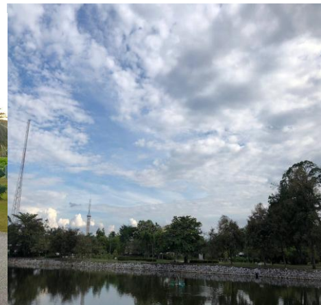
ภาพที่ 3: สวนสาธารณะกุดป่อง