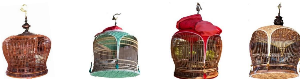
รูปที่ 2 กรงนกเขาวารูปแบบต่าง ๆ

สำหรับรูปแบบการทำกรงนกของชาวบ้านในชุมชนที่นิยมทำมีอยู่ด้วยกัน 3 แบบ ได้แก่ 1) กรงโขนงหวาย เป็นกรงที่มีหวายทำเป็นโขนงหลายเส้น ที่นิยมทำกันมาก ได้แก่ กรงโขนงหวายธรรมดา กรงโขนงหวายทรงเสด็จ และกรงโขนงหวายสวย เป็นต้น กรงโขนงหวายนอกจากมีความสวยงามแล้วยังให้ความปลอดภัยต่อกัน เนื่องจากสามารถป้องกันแมลงได้เป็นอย่างดี เพราะซี่ของกรงมีขนาดเล็กมากและมีช่องไฟแน่น กรงโขนงหวายเหมาะกับการเลี้ยงนกที่แฉวนไวที่ต่ำ ๆ เพื่อฟังเสียงร้อง 2) กรงผูก เป็นกรงที่เน้นไปที่การผูกไม้ไผ่ให้กรงได้รูปทรงตามที่ต้องการ เช่น ทรงโกหยา ทรงเสด็จ ทรงธรรมดา และทรงแกะสลัก เป็นต้น โดยซี่ของกรงแบบผูกจะเหลาแบบปลายเรียว กลางโต และโคนของซี่เรียวเล็กลงมาสามารถดัดแปลงกรงเป็นรูปทรงต่าง ๆ ได้ จึงได้รับความนิยมสูง กรงผูกเหมาะกับการใส่นกที่จะแข่งขัน เนื่องจากมีพื้นที่มาก นกสามารถกระพือปีกได้อย่างอิสระ และ 3) กรงลูก มีรูปทรงคล้ายกรงโขนงหวาย จะแตกต่างกันตรงที่ซี่กรงมีขนาดใหญ่กว่า การวางหวายเพื่อเป็นโขนงระยะก็จะต่างกัน ส่วนซี่จะเหลาขนาดเกือบเท่ากันหมด ยกเว้นช่วงปลายเท่านั้นที่เหลาให้เล็กลง เพื่อความสะดวกในการประกอบ กรงลูกเหมาะกับการเลี้ยงลูกนก เนื่องจากจะนิยมทำประตูข้างจึงสะดวกในการจับลูกนกเข้า-ออก โดยกรงนกทั้ง 3 แบบ จะมีหลายรูปทรงและหลายขนาด (สำนักส่งเสริมการปกครองท้องถิ่นจังหวัดสงขลา, 2559)