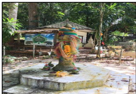
ภาพที่ 2 เสาหลักเมืองตะโหมด หรือ โต๊ะละหมาด