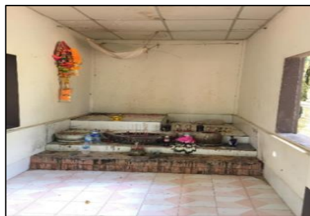
ภาพที่ 3 ศาลาตาหมอเฒ่า