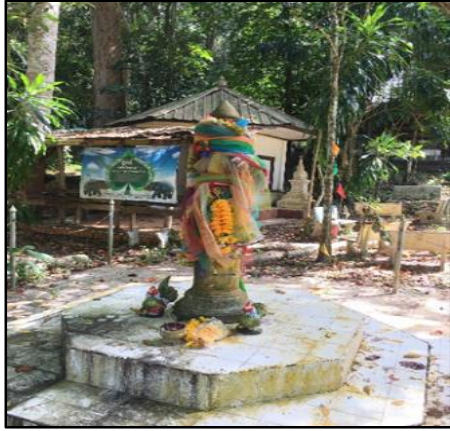
ภาพที่ 2 เสาหลักเมืองตะโหมต หรือ โต๊ะละหมาด