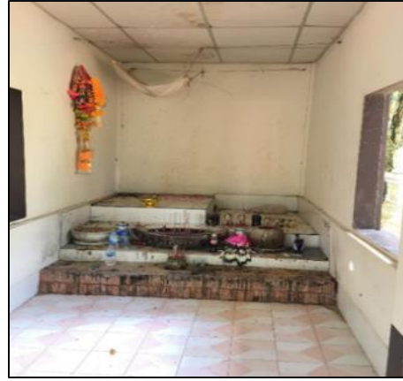
ภาพที่ 3 ศาลาตามอเฒ่า