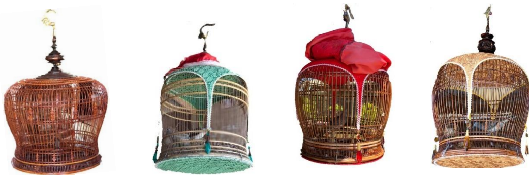
รูปที่ 2 กรงนกเขาวาารูปแบบต่าง ๆ

สำหรับรูปแบบการทำกรงนกของชาวบ้านในชุมชนบ้านนาที่นิยมทำมีอยู่ด้วยกัน 3 แบบ ได้แก่ 1) กรงโขนงหวาย เป็นกรงที่มีหวายทำเป็นโขนงหลายเส้น ที่นิยมทำกันมาก ได้แก่ กรงโขนงหวายธรรมดา กรงโขนงหวายทรงเตี้ย และกรงโขนงหวายสวย เป็นต้น กรงโขนงหวายนอกจากมีความสวยงามแล้วยังให้ความปลอดภัยต่อกัน เนื่องจากสามารถป้องกันแมลงได้เป็นอย่างดี เพราะซี่ของกรงมีขนาดเล็กมาก และมีช่องไฟแน่น กรงโขนงหวายเหมาะกับการเลี้ยงนกที่แฉวนไว้นิ่ง ๆ เพื่อฟังเสียงร้อง 2) กรงผูก เป็นกรงที่เน้นไปที่การผูกไม้ไผ่ให้กรงได้รูปทรงตามที่ต้องการ เช่น ทรงโกหยี ทรงแสดง ทรงธรรมดา และทรงกะสลัก เป็นต้น โดยซี่ของกรงแบบผูกจะเหลาแบบปลายเรียว กลางโต และโคนของซี่เรียวเล็กลงมาสามารถดัดแปลงกรงเป็นรูปทรงต่าง ๆ ได้ จึงได้รับความนิยมสูง กรงผูกเหมาะกับการใส่คนที่แข่งขัน เนื่องจากมีพื้นที่มาก นกสามารถกระพือปีกได้อย่างอิสระ และ 3) กรงลูก มีรูปทรงคล้ายกรงโขนงหวาย จะแตกต่างกันตรงที่ซี่กรงมีขนาดใหญ่กว่า การวางหวายเพื่อเป็นโขนงระยะก็จะต่างกัน ส่วนซี่จะเหลาขนาดเกือบเท่ากันหมด ยกเว้นช่วงปลายเท่านั้นที่เหลาให้เล็กลง เพื่อความสะดวกในการประกอบ กรงลูกเหมาะกับการเลี้ยงลูกนก เนื่องจากจะนิยมทำประตูข้างจึงสะดวกในการจับลูกนกเข้า-ออก โดยกรงนกทั้ง 3 แบบ จะมีหลายรูปทรงและหลายขนาด (สำนักส่งเสริมการปกครองท้องถิ่นจังหวัดสงขลา, 2559)