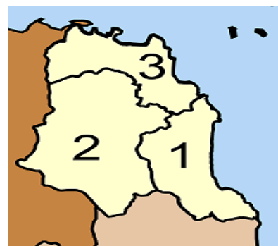
รูปที่ 2 แผนที่อำเภอนอม